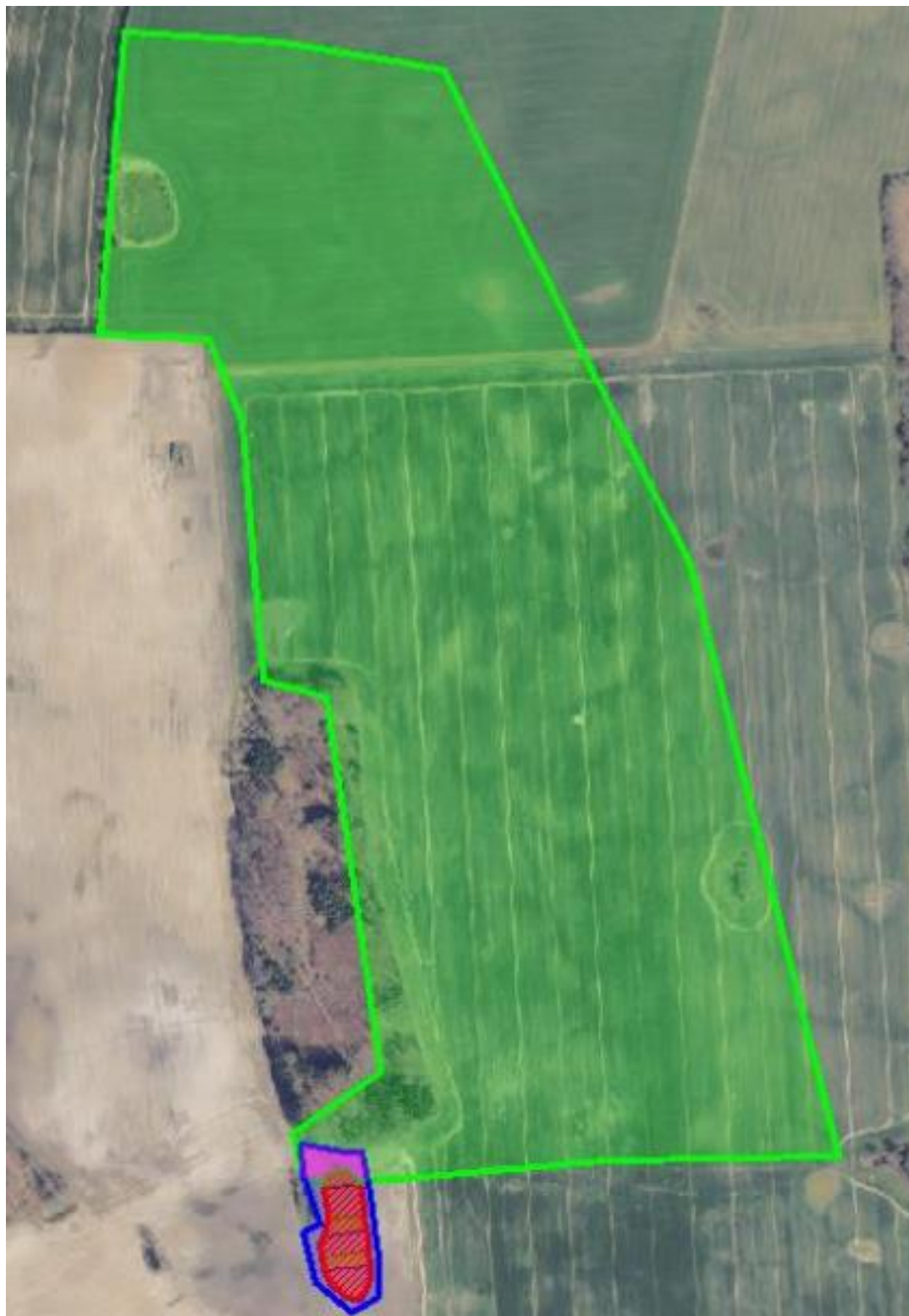
Kortbilag 4. Drænolandet er markeret med grønt, projektområdet er blå, og minivådområdets vandspejl er rødt.