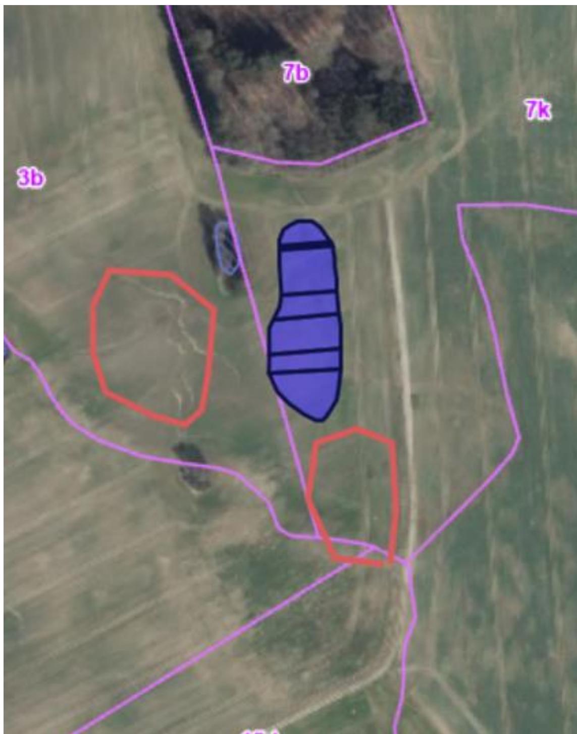
Kortbilag 3. Placering af minivådområde er skrueret med blå. Overskudsjorden placeres inden for de røde linjer. Før udlægning afgraves muldjorden delvist (cirka 15 cm). Jorden lægges herefter ud i max 0,5 meters højde.