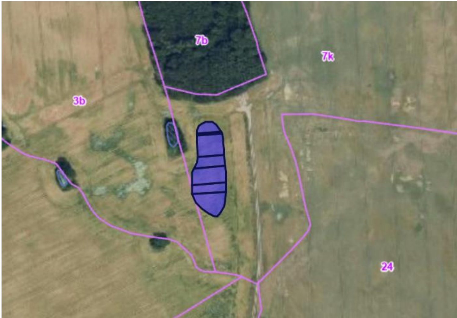
Kortbilag 2. Oversigtskort, der viser minivådområdets placering på matriklen.